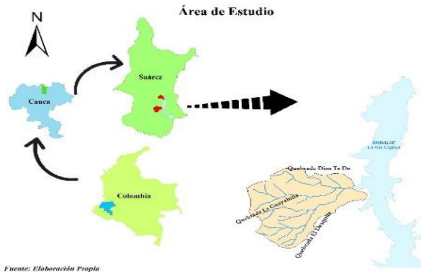
Figura 1: Ubicación área de estudio

Los suelos pertenecen a ecosistemas de montaña en alturas comprendidas entre 1299 y 1663 msnm, originados de cenizas volcánicas y rocas ígneas.